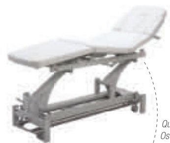
Quadroflex Osteo Luxe