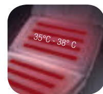
Alle Luxekussens: GRATIS kussenverwarming

Alle 'Advanced' modellen zijn verkrijgbaar in 'Luxe'-uitvoering en omgekeerd