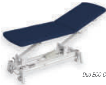
Duo ECO COMFORT