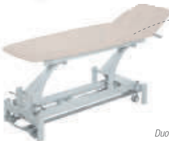
Duo flex Luxe