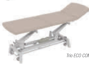
Trio ECO COMFORT